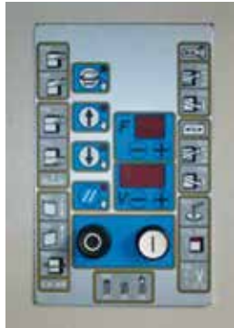
Bedienpanel CST 211